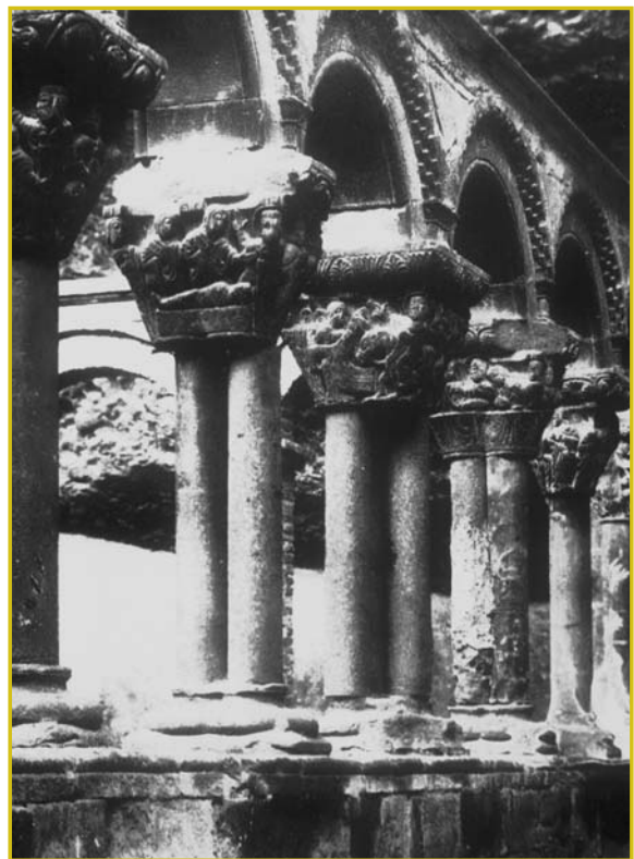
Ala del claustro en 1878