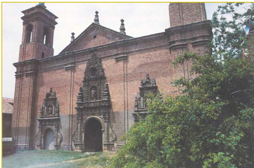
Fachada del monasterio alto

dido del Ministerio de Instrucción pública y Bellas Artes y así lo ha entendido al dictar la Real orden de 18 de junio de 1921, por la que se cedió temporalmente el Patronato de Colonias escolares de Zaragoza una parte del referido Monasterio, con las condiciones en la misma impuestas