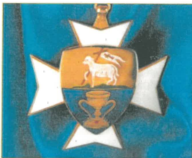
Medalla de la Real Hermandad

El escudo podrá ir también en otros soportes, tales como en una insignia de solapa, en una corbata, en un pañuelo o en otros, cuyo modelo será siempre aprobado por el Consejo Rector, a quien también corresponde en exclusiva su confección. Nadie podrá utilizar la imagen del escudo en otro formato o soporte si no cuenta previamente con la autorización escrita del Consejo Rector.