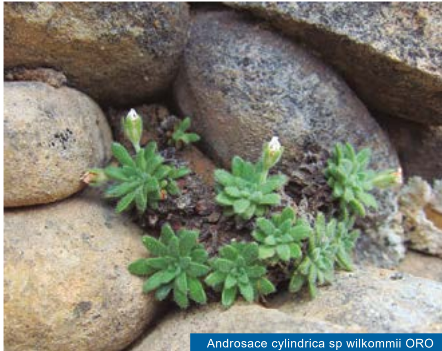
Androsace cylindrica sp. willkommii ORO

el Monasterio Viejo” son las más frondosas que conocemos. Sin movernos del sitio, observamos en las mismas paredes de conglomerado, sobre el claustro románico, una “rompepiedras” ( Petrococtis hispanica ) descubierta y descrita aquí por un botánico sajón, Mauritius Willkomm, que recorrió nuestro país a mediados del siglo XIX. Ya puestos, junto a estas dos especies tan destacables encontraremos, también en flor a mitad de junio, la llamativa “corona de rey” ( Saxifraga longifolia ) cuya floración majestuosa precede a la muerte de la planta. También abundan varios helechos de pequeña talla ( Asplenium trichomanes y A. fontanum ) y una valeriana enana ( Valeriana longiflora ) endémica del nordeste peninsular. Estas plantas viven en la roca y es en este ambiente donde podemos observar la flora más diversa y también la más interesantes para los botánicos porque en ese entorno inhóspito –vertical, seco, con fuertes contrastes térmicos- han encontrado humilde refugio las plantas más antiguas que no pueden disputar las tierras más feraces a los árboles y arbustos. En grietas de las paredes más altas de la Peña Oroel, y solo allí en todo el planeta, vive otra joya botánica por su extraordinaria rareza; se trata de una pequeña matita con forma almohadillada que se cubre de flores blancas en primavera y es muy longeva. Como otras plantas de vida discreta no tiene