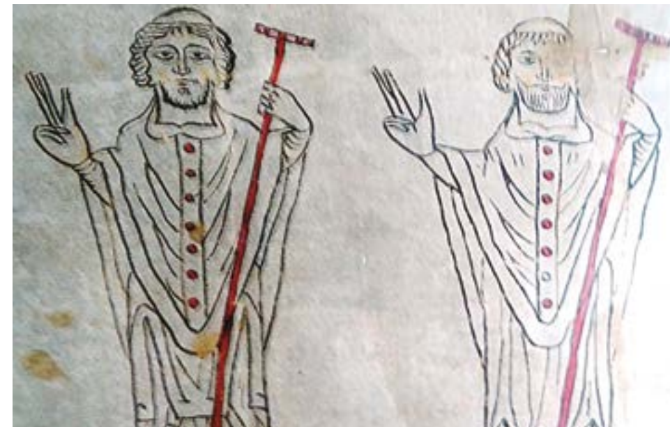
Detalle de las Actas del Concilio de Jaca, copia C2 en el Archivo de la Jaca con las representaciones de los abades de San Juan de la Peña y de San Andrés de Fanlo.

y la música del oficio; de hecho, sobre las líneas aparece los signos de la notación musical, y de la misa de las festividades comprendidas entre fines de enero y principios de marzo. Los títulos y las rúbricas primitivos son de la misma mano del texto, con las letras capitales en rojo y azul y las iniciales están ornamentadas en rojo, azul y amarillo. La primera página sirvió de encuadernación a otros escritos pinatenses que bajo el título de «Libro de San Voto» 4 , está compuesto por restos de manuscritos de diversas épocas.