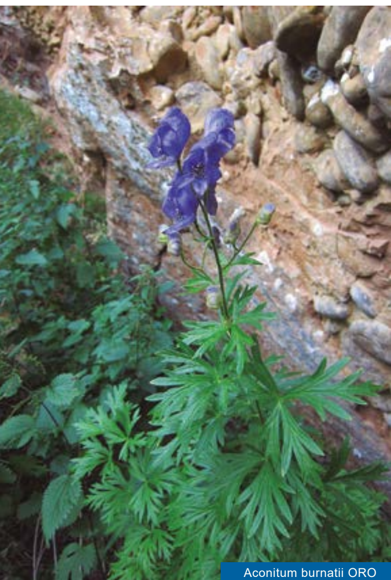
Aconitum burnatii ORO

logía experimental (actual IPE) desde su fundación hace casi ochenta años y los resultados que cubren los ámbitos de la geología, geomorfología, clima, flora, vegetación, fauna vertebrada e invertebrada, ecología forestal, etc. están escritas en tesis doctorales, monografías y numerosos estudios cuya enumeración detallada puede consultar quien le interese en una reciente recopilación. Pocos lugares en nuestro país gozan de un aval de estudios tan extenso. Para quien no requiera tanto detalle, una explicación general pero muy bien documentada, explicada y “musealizada” se puede observar en una agradable visita al centro de interpretación del espacio protegido que se ubica en la pradera de San Indalecio.