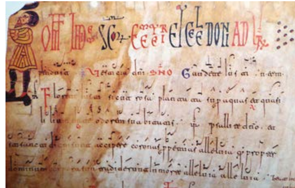
Detalle del folio 4 v del manuscrito 418 de la Biblioteca Universitaria de Zaragoza con el oficio dedicado a los mártires calagurritanos Santos Emeterio y Celedonio que se celebraba el día 3 de marzo. En la parte superior izquierda, aunque mutilada, se aprecia la representación de una pequeña figura humana que quizás represente a uno de ellos que la tradición considera hermanos.

En la Península Ibérica y en algún territorio del sur de Francia -la llamada Galia Narbonense- se empleó la liturgia hispánica que se fue fijando en torno al siglo VI, y se consolidó aun más en la siguiente centuria, en el reino visigodo de Toledo por lo que también es conocida como visigótica y toledana. Tras la ocupación islámica a principios del siglo VIII pervivió, tanto en las áreas cristianas